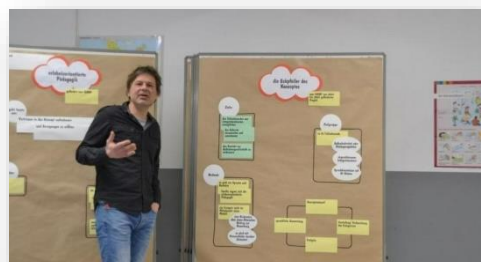
Projektleiter: Marco Giese