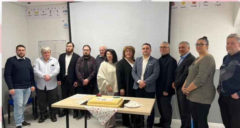
Der neue gewählte Vorstand des EWB 2023