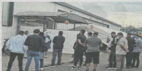
Vor dem Impfzentrum Elmshorn erfolgt eine Aufklärung in arabischer Sprache.

In Zusammenarbeit mit dem Gesundheitsamt ist es Öznarin gelungen, einen Terminblock im Impfzentrum Elmshorn für insgesamt 45