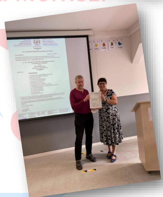
Gesamtvorstandsbild von der 27. Mitgliederversammlung des EWB 2021