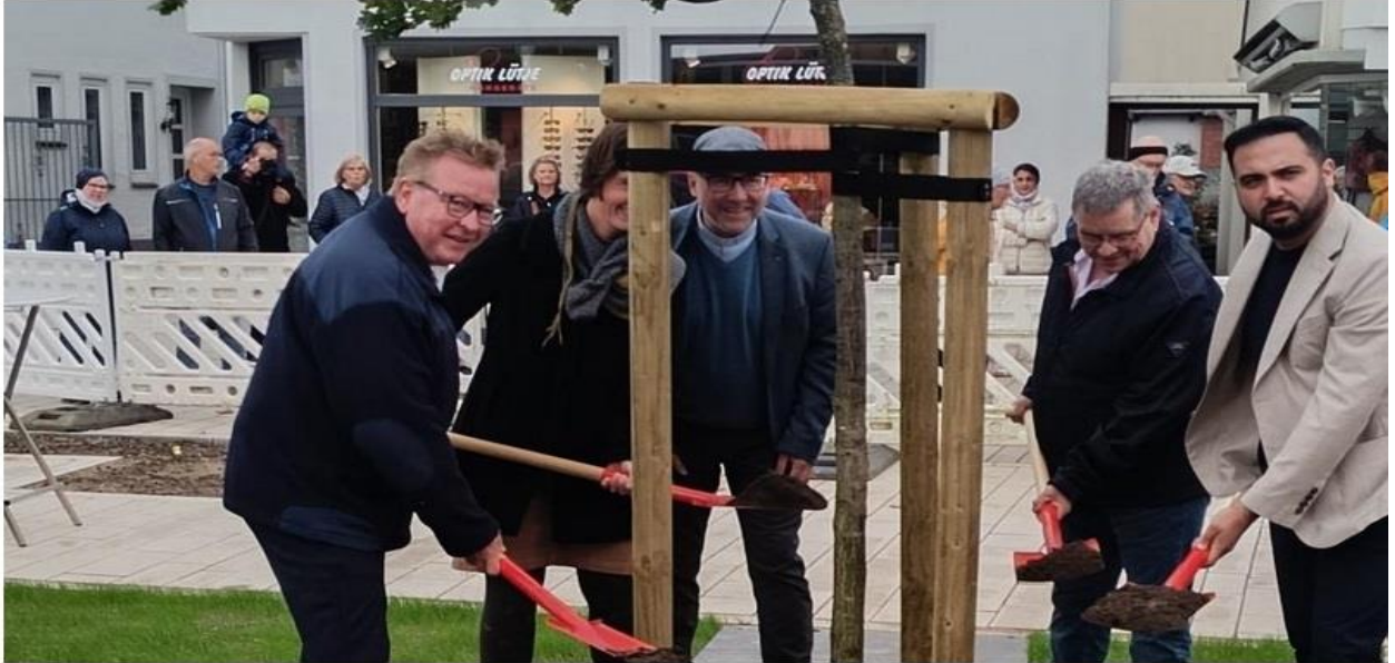
Ein feierlicher Moment: Die Friedenseiche wird am Brunnenplatz eingepflanzt.

Büsum · Jörg Ampting · Dienstag, 10. Oktober 2023