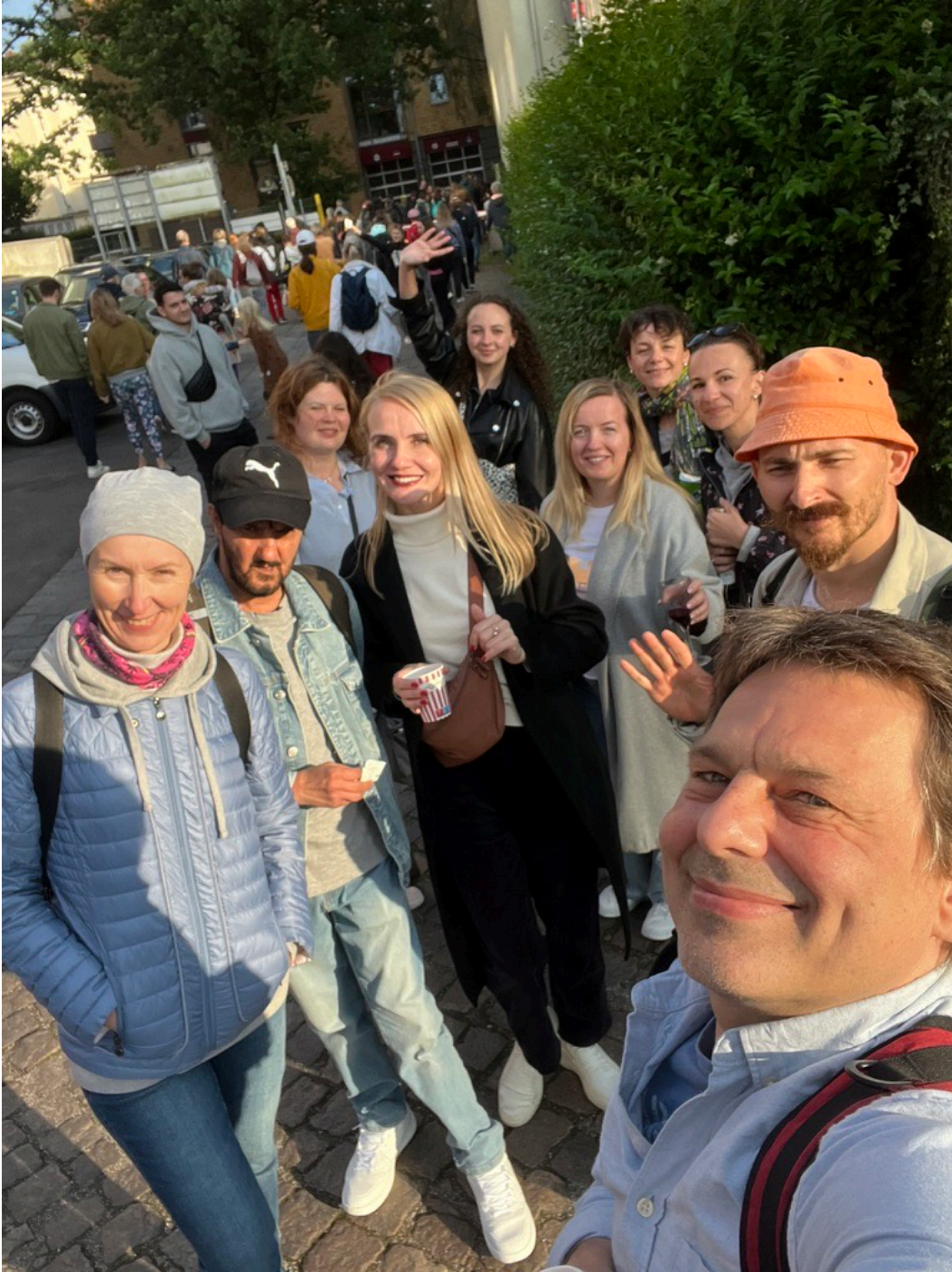
Bild: Gemeinsame Aktivitäten stärken Selbstvertrauen und gesellschaftliche Teilhabe.