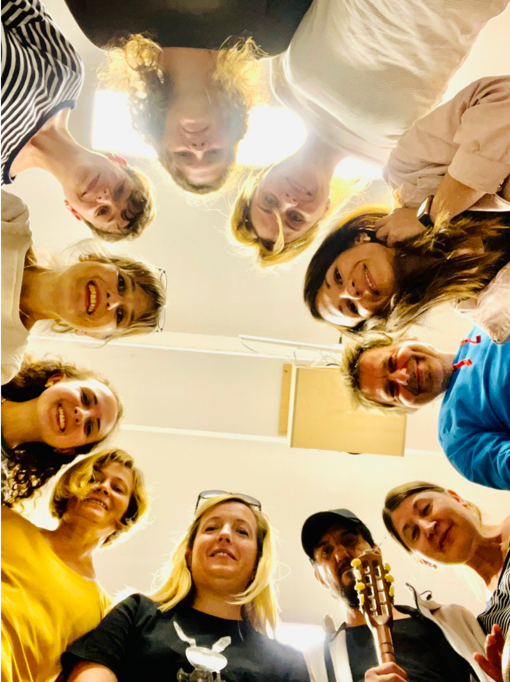
Bild: Teilnehmende der ErlebnisLernstatt bei gemeinsamen Aktivitäten und Präsentationen.